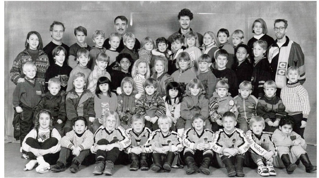
Skridskoskolan grupp 3 och E-pojkar