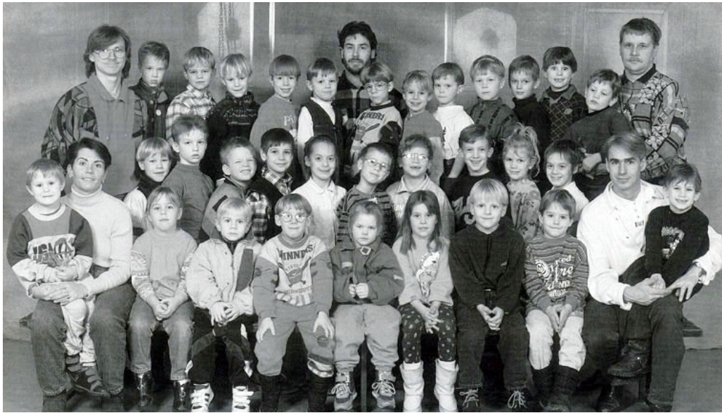
Skridskoskolan grupp 1