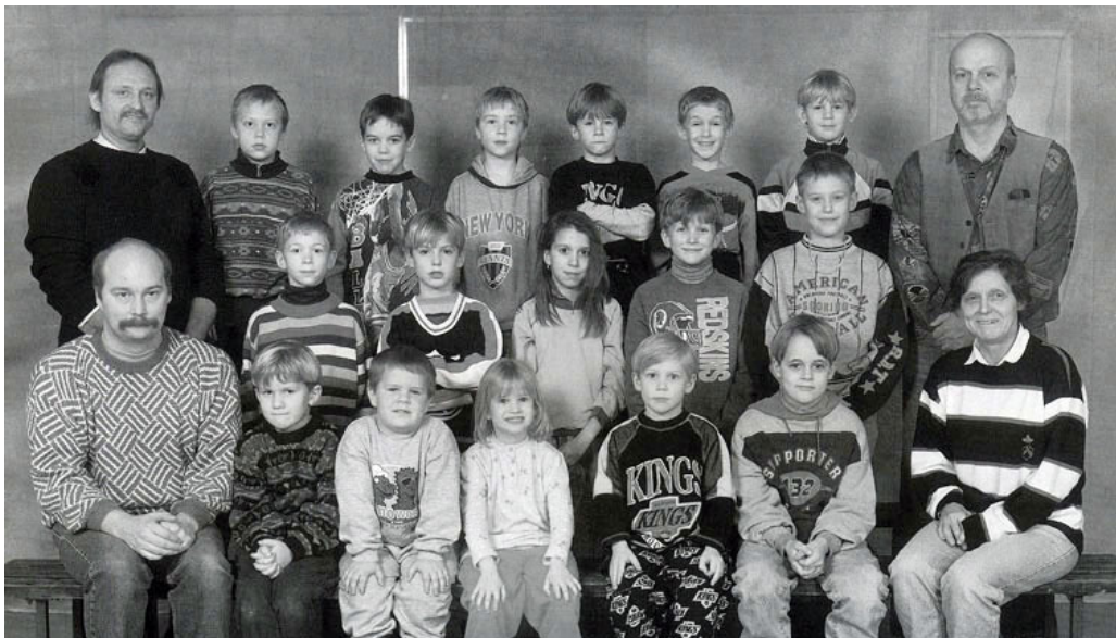
Skridskoskolan grupp 2