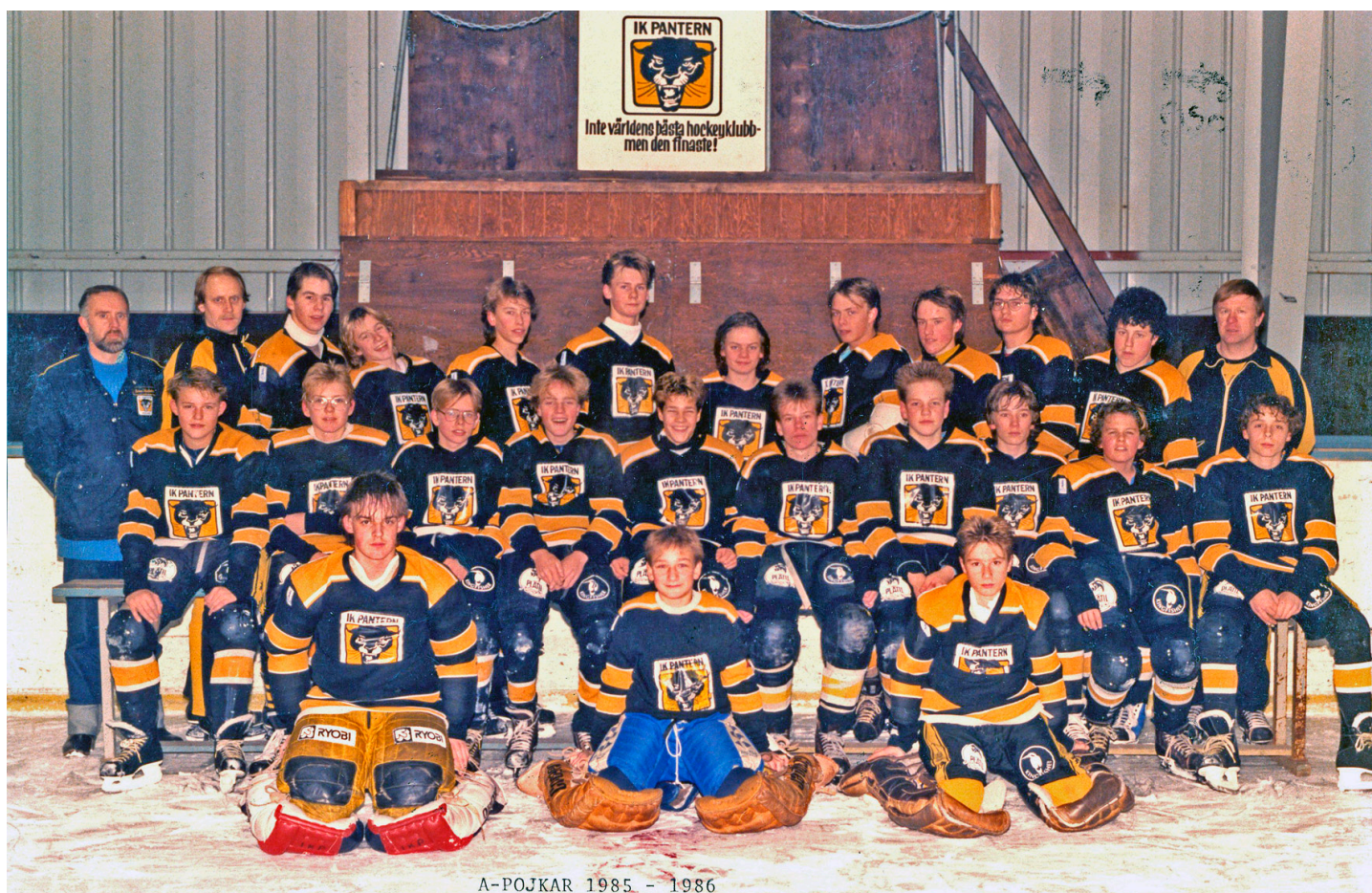
A-POJKAR 1985 - 1986